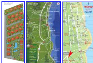
Områdekart Golfkart Kart hua hin