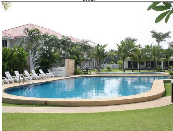
Fellesannlegg sett mot leiligheter L4-3xx og klubbhus