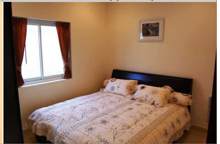
Soverom 2 og 3