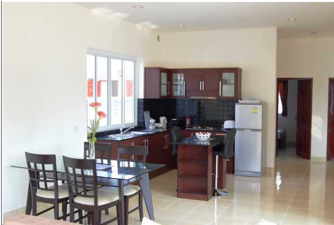
Kjøkken leveres med komfyrtopp(3x gass+1 elektrisk) og Kjøleskap med fryser