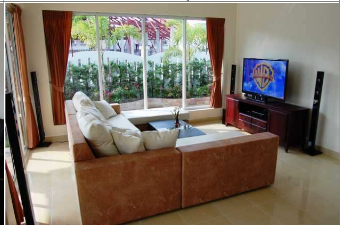
Stue sett mot patio