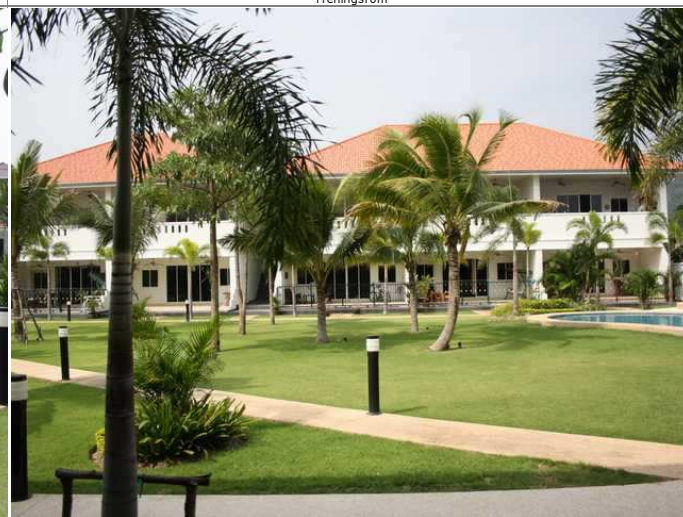
Fellesannlegg sett mot leiligheter L4-3xx