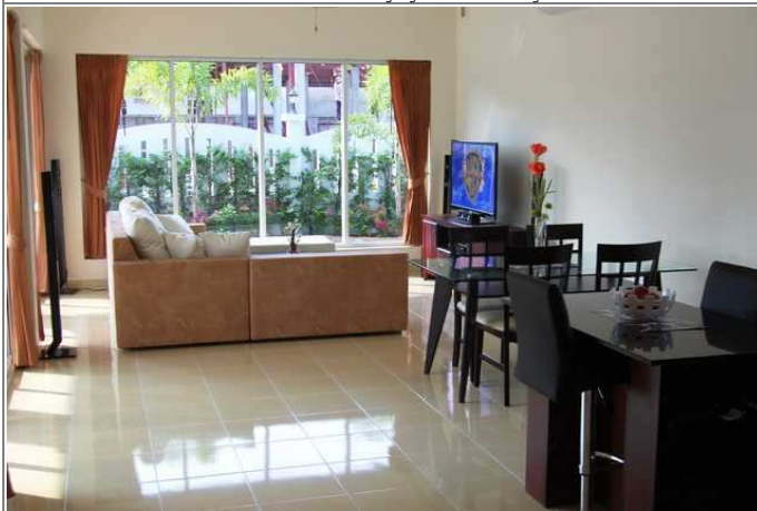
Stue sett fra kjøkken