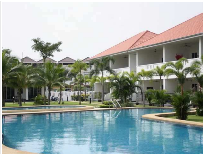
Hovedbasseng og barnebasseng sett mot leiligheter L4-1xx og 2xxx