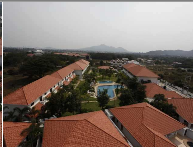
Fellesannlegg fra luften sett sydover