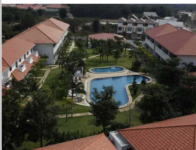
Fellesanlegg fra luften sett sydover