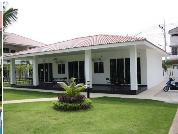
Klubbhus med servicekontor, biljard, treningsrom og TV