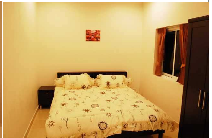
Master bedroom Med utgang direkte til basseng