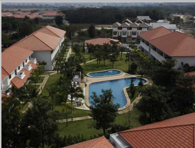
Fellesannlegg fra luften sett sydover

hua-hin.no Elgveien 31 Boks 2048 3003 Drammen Tlf: 970 57 000 E-post: johnny@hua-hin.no