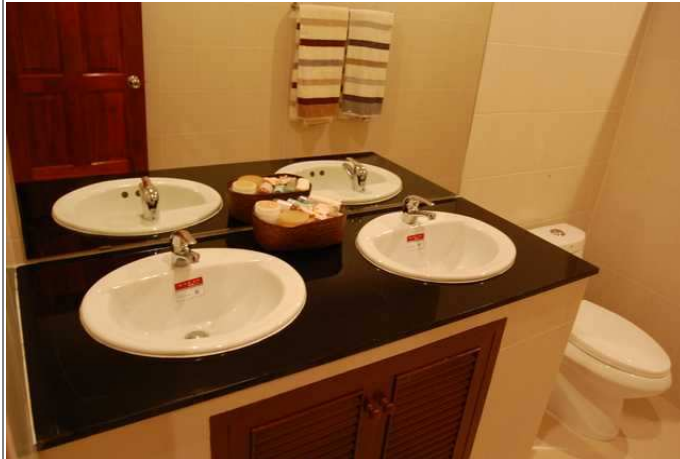
Bad i tilknytning til master bedroom