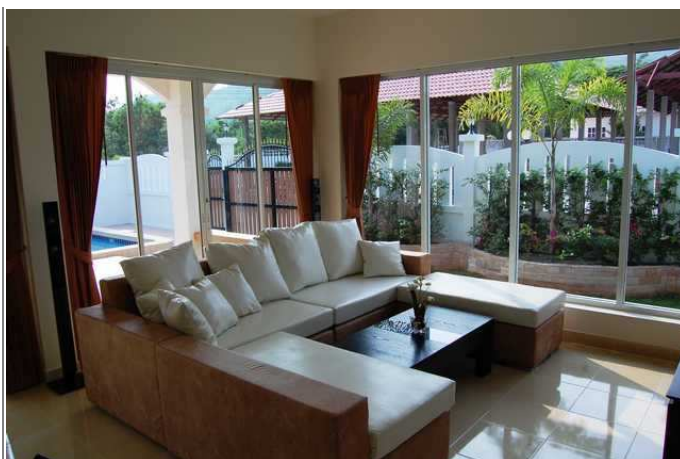
Stue sett mot fronten av huset.