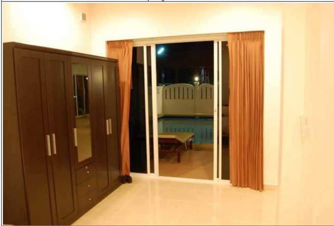
Master bedroom Med utgang direkte til basseng